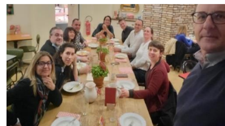
Wspólne spotkanie w Mediolanie