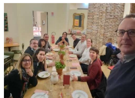
One of the moments of the meeting in Milan

E' uno strumento molto utile per i partner per dare valore al materiale che è stato prodotto e che verrà prodotto anche a progetto concluso.